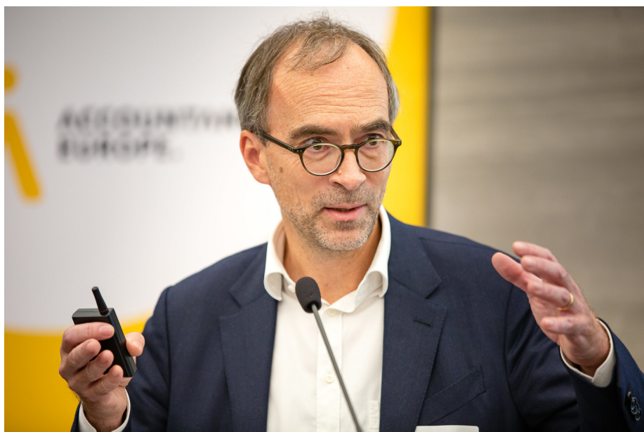
Jens Poll, președintele Grupului European al Rețelelor și Asociațiilor Internaționale de Contabilitate

asigurare trebuie să lucreze suficient de aproape de expert ca să își poată asuma răspunderea pentru rezultatul final.